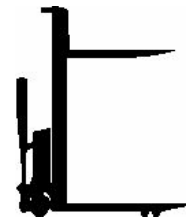
Fahren und Heben elektrisch

Bitte beantworten Sie nun noch die folgenden Fragen: