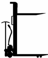
Fahren + Heben von Hand